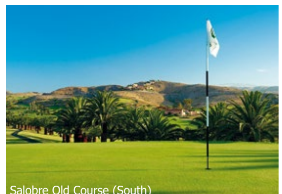
Salobre Old Course (South)

WICHTIG: Limitierte Anzahl Flugplätze zu oben stehenden Konditionen. Ist die berechnete Buchungsklasse nicht mehr verfügbar, behalten wir uns vor, den Flugzuschlag aufzurechnen. Früh buchen lohnt sich! d_Onb350