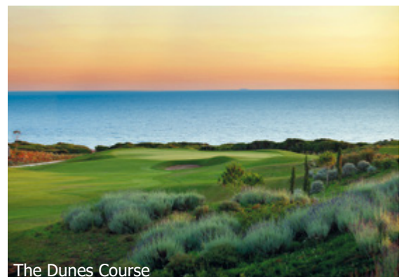
The Dunes Course