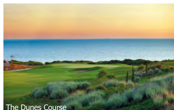
The Dunes Course

WICHTIG: Limitierte Anzahl Flugplätze zu oben stehenden Konditionen. Ist die berechnete Buchungsklasse nicht mehr verfügbar, behalten wir uns vor, den Flugzuschlag aufzurechnen. Früh buchen lohnt sich! 1tb300