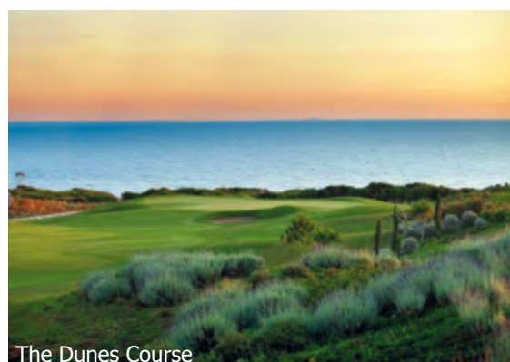
The Dunes Course

WICHTIG: Limitierte Anzahl Flugplätze zu oben stehenden Konditionen. Ist die berechnete Buchungsklasse nicht mehr verfügbar, behalten wir uns vor, den Flugzuschlag aufzurechnen. Früh buchen lohnt sich!