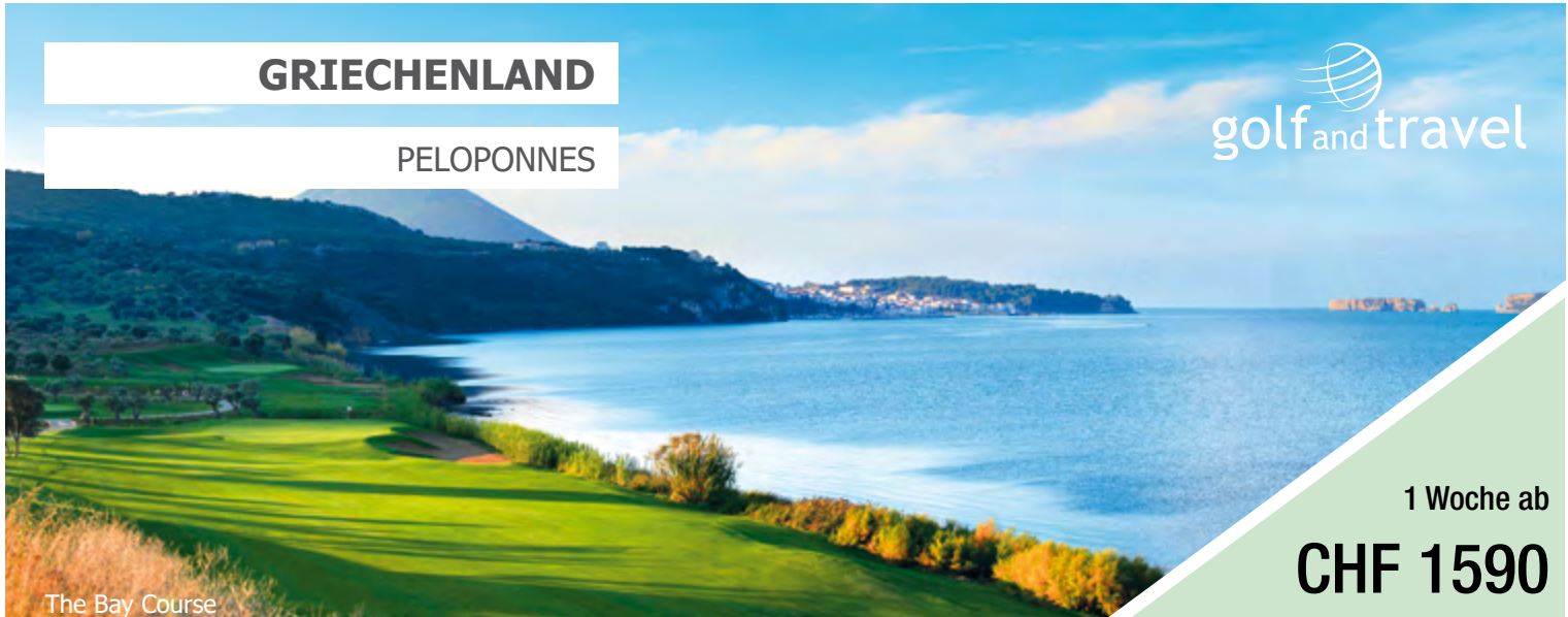
The Bay Course