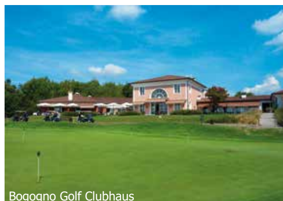
Bogogno Golf Clubhaus