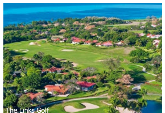
The Links Golf