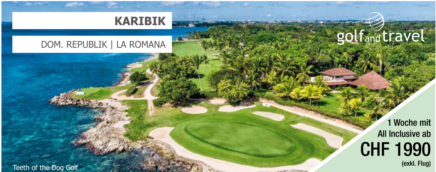
Teeth of the Dog Golf

1 Woche mit All Inclusive ab CHF 1990 (exkl. Flug)