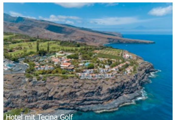
Hotel mit Tecina Golf

INBEGRIFFEN 1 Greenfee Tecina Golf, 1 Fährticket, sowie 1 Auto-Fährticket (Basis 2 Personen) von Teneriffa nach La Gomera retour (exkl. Übernachtung)