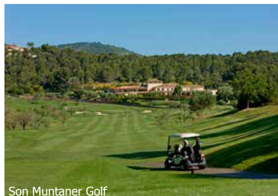
Son Muntaner Golf

WICHTIG: Limitierte Anzahl Flugplätze zu oben stehenden Konditionen. Ist die berechnete Buchungsklasse nicht mehr verfügbar, behalten wir uns vor, den Flugzuschlag aufzurechnen. Früh buchen lohnt sich! nb250/250