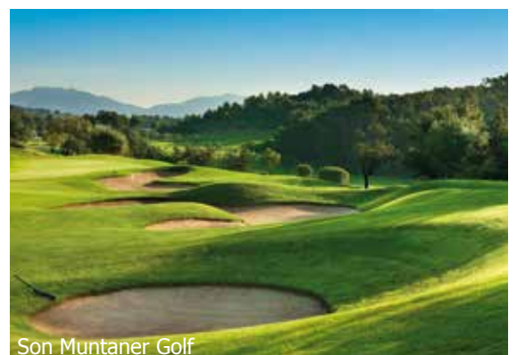
Son Muntaner Golf

WICHTIG: Limitierte Anzahl Flugplätze zu oben stehenden Konditionen. Ist die berechnete Buchungsklasse nicht mehr verfügbar, behalten wir uns vor, den Flugzuschlag aufzurechnen. Früh buchen lohnt sich! nb250/250