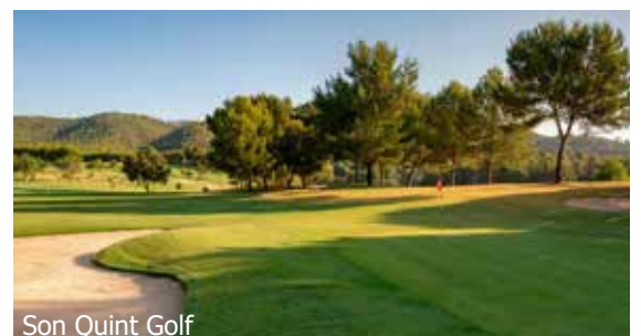
Son Quint Golf

WICHTIG: Limitierte Anzahl Flugplätze zu oben stehenden Konditionen. Ist die berechnete Buchungsklasse nicht mehr verfügbar, behalten wir uns vor, den Flugzuschlag aufzurechnen. Früh buchen lohnt sich! ar200/250