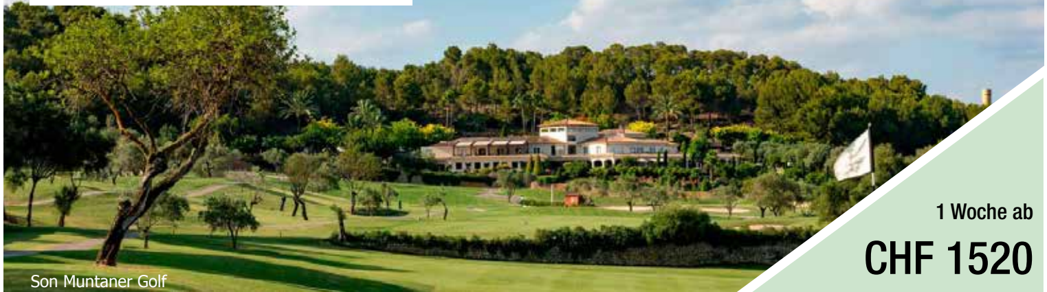
Son Muntaner Golf