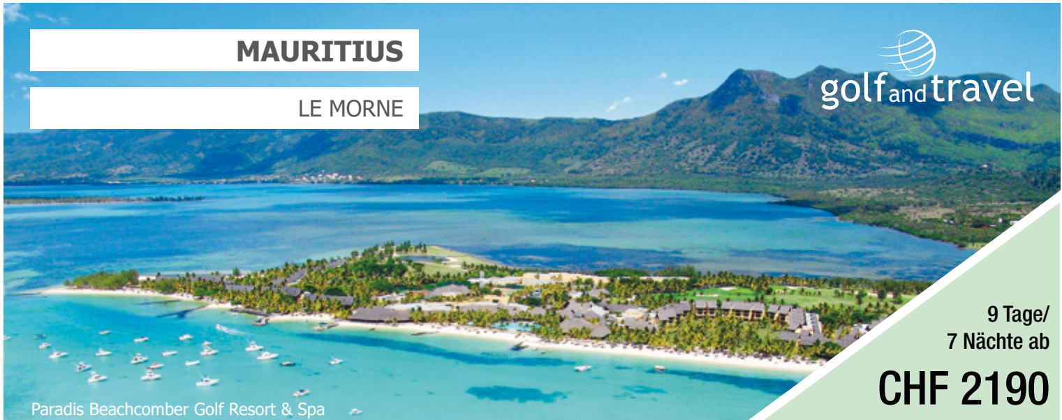
Paradis Beachcomber Golf Resort & Spa