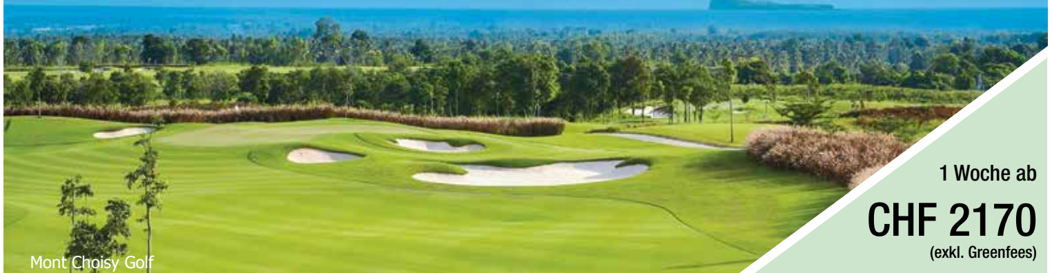
Mont Choisy Golf