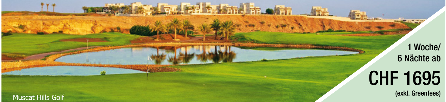
Muscat Hills Golf