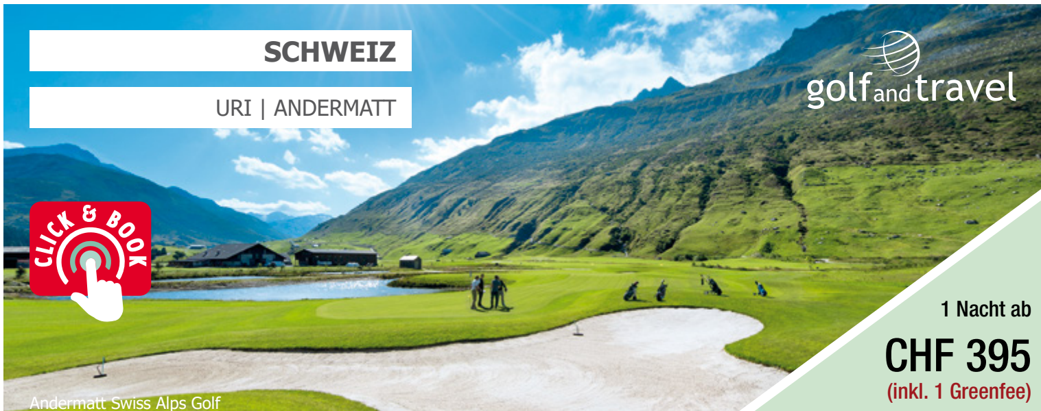
Andermatt Swiss Alps Golf