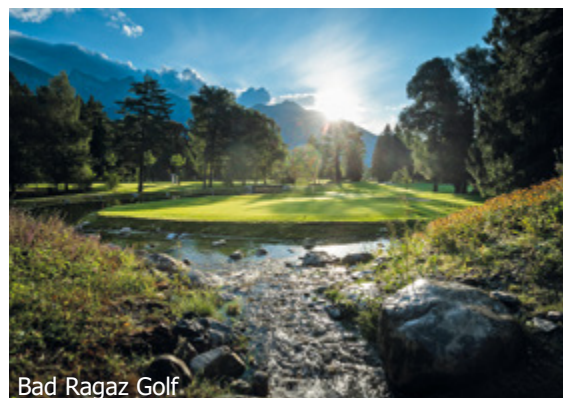
Bad Ragaz Golf