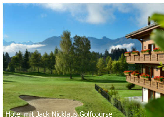
Hotel mit Jack Nicklaus Golfcourse