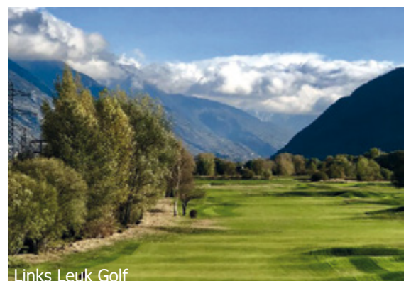
Links Leuk Golf