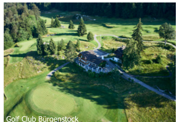
Golf Club Bürgenstock