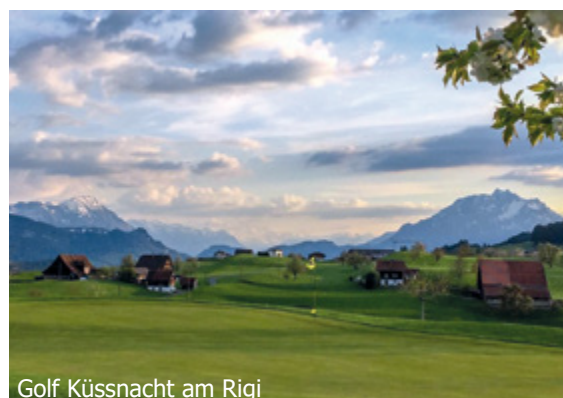
Golf Küssnacht am Rigi