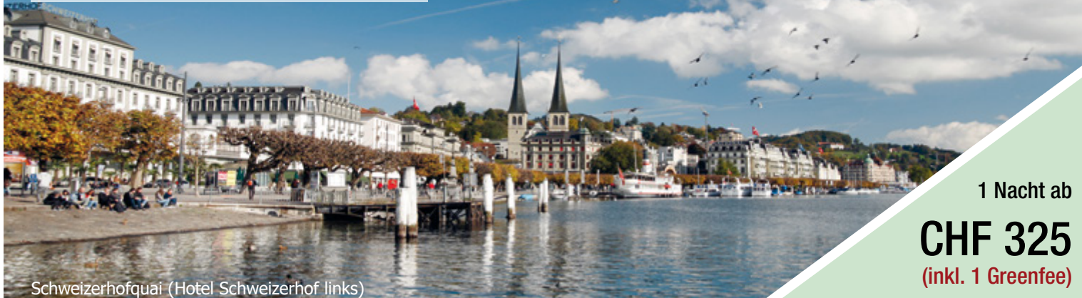
Schweizerhofquai (Hotel Schweizerhof links)