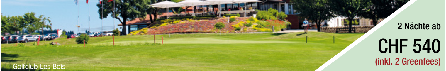
Golfclub Les Bois