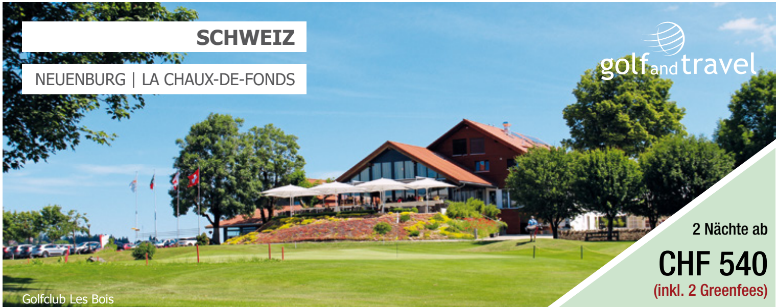
Golfclub Les Bois