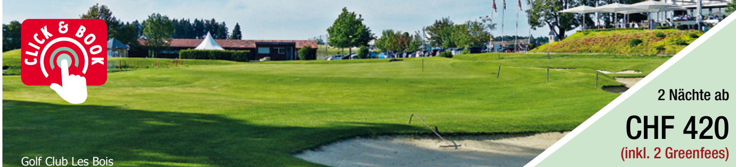
Golf Club Les Bois