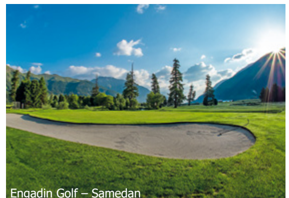
Engadin Golf – Samedan