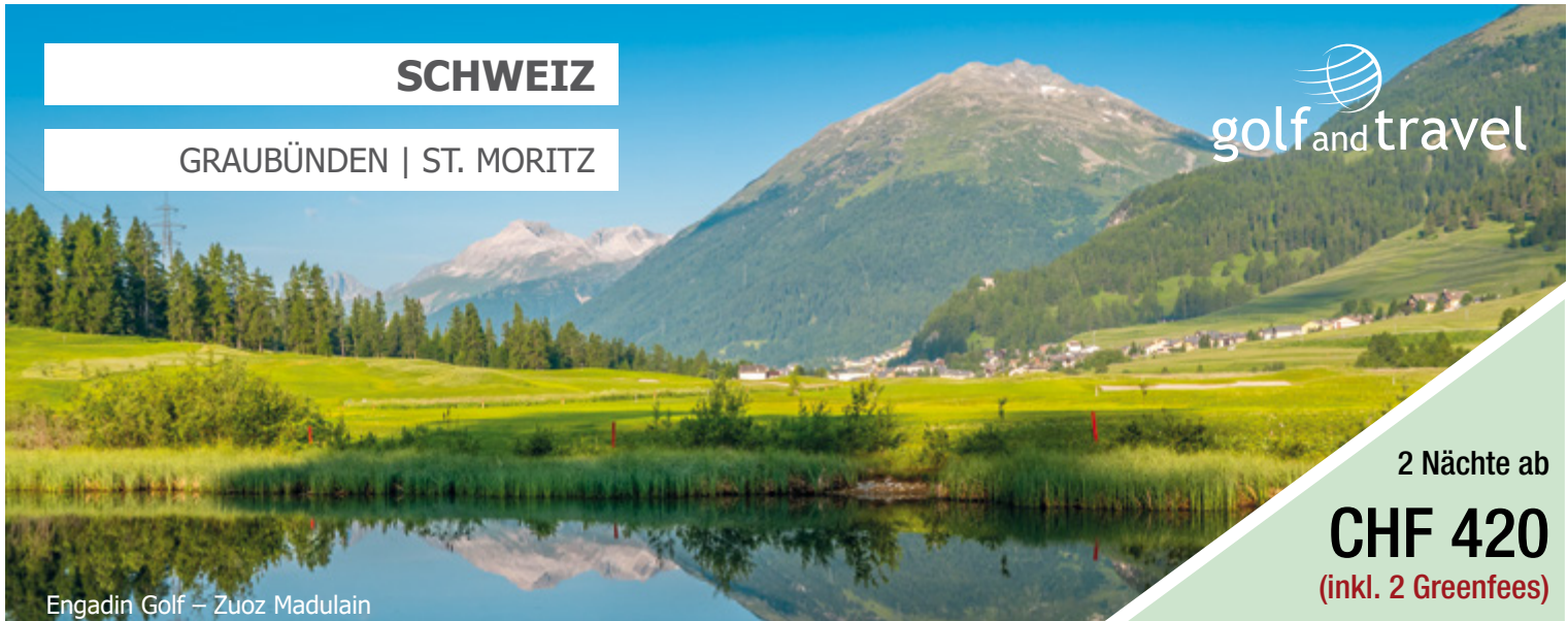
Engadin Golf – Zuoz Madulain