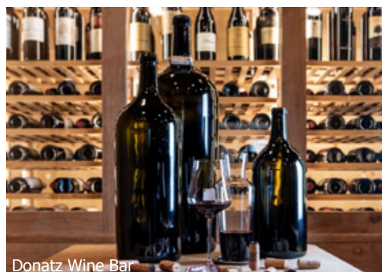
Donatz Wine Bar