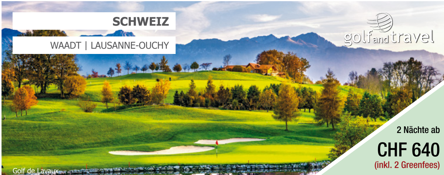
Golf de Lavaux