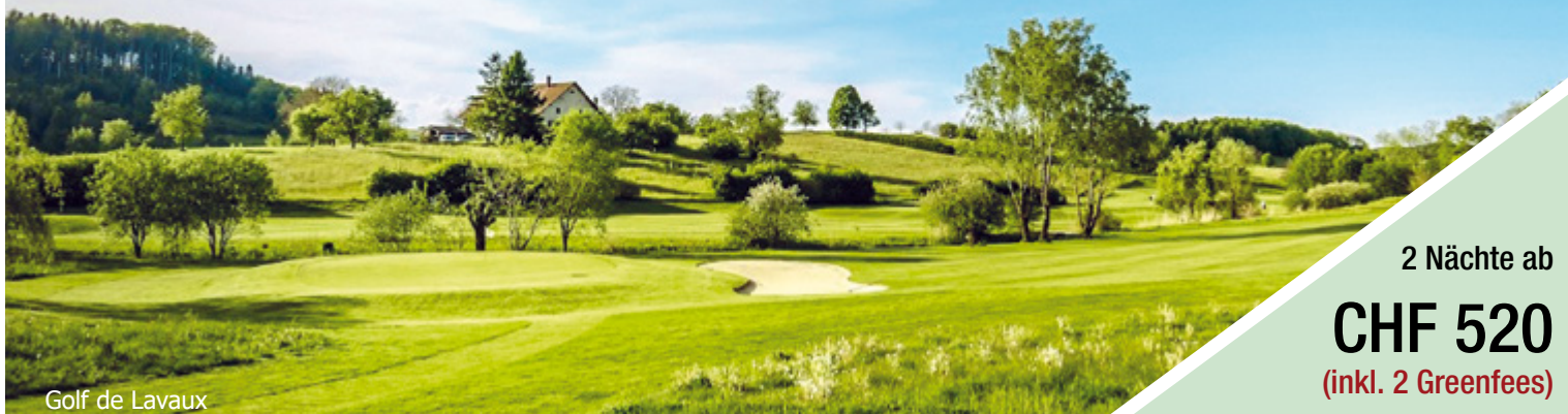
Golf de Lavaux