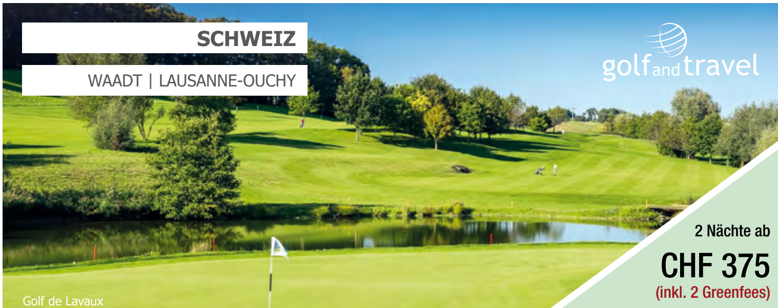
Golf de Lavaux