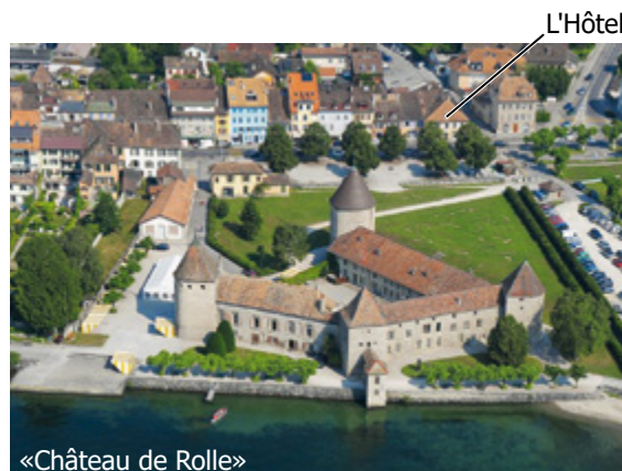
«Château de Rolle»