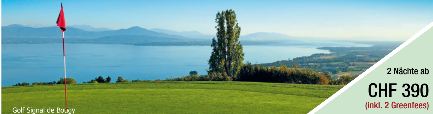
Golf Signal de Bougy