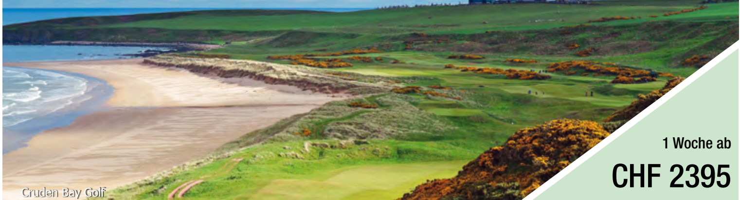
Cruden Bay Golf