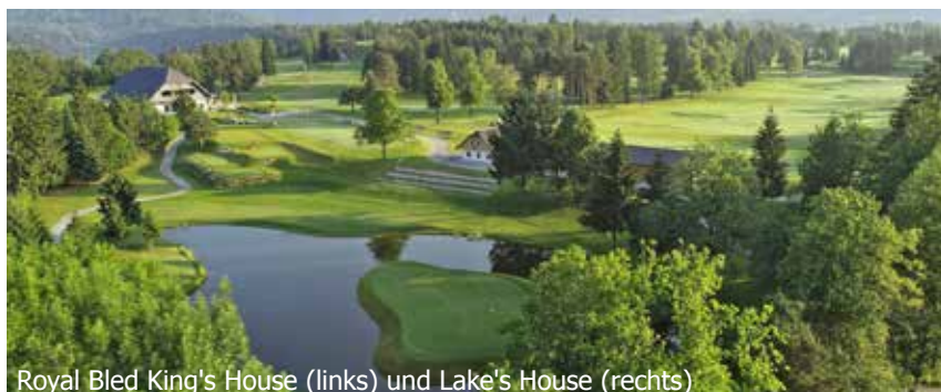
Royal Bled King's House (links) und Lake's House (rechts)