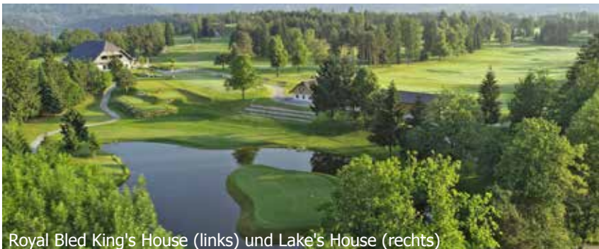
Royal Bled King's House (links) und Lake's House (rechts)

Der King's Golfplatz ist der älteste und grösste Golfcourse Sloweniens. Die Ursprünge reichen bis ins Jahr 1937 zurück, und viele Besucher behaupten, es sei einer der schönsten Golfplätze Europas. Weiter gibt es eine moderne Golf-Akademie mit Übungsplatz, welche sich in einzigartiger Lage befindetet mit herrlichem Ausblick zum Gebirge.