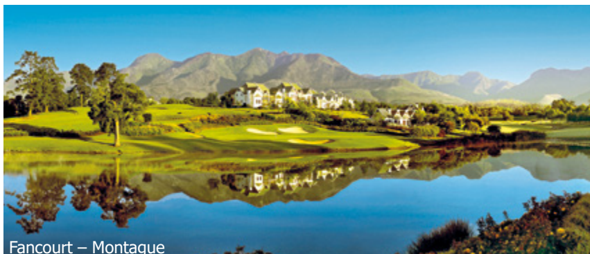
Fancourt – Montague