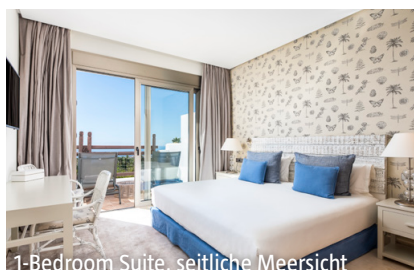
1-Bedroom Suite, seitliche Meersicht

Sport/Wellness: 450 m 2 grosses Spa mit Sauna, Dampfbad, Relaxing-Area und breitem Angebot an Körper- und Gesichtsbearbeitungen. Fitnessstudio, Tennis, Golf, Kids Camp ausserhalb der Hotelanlage.