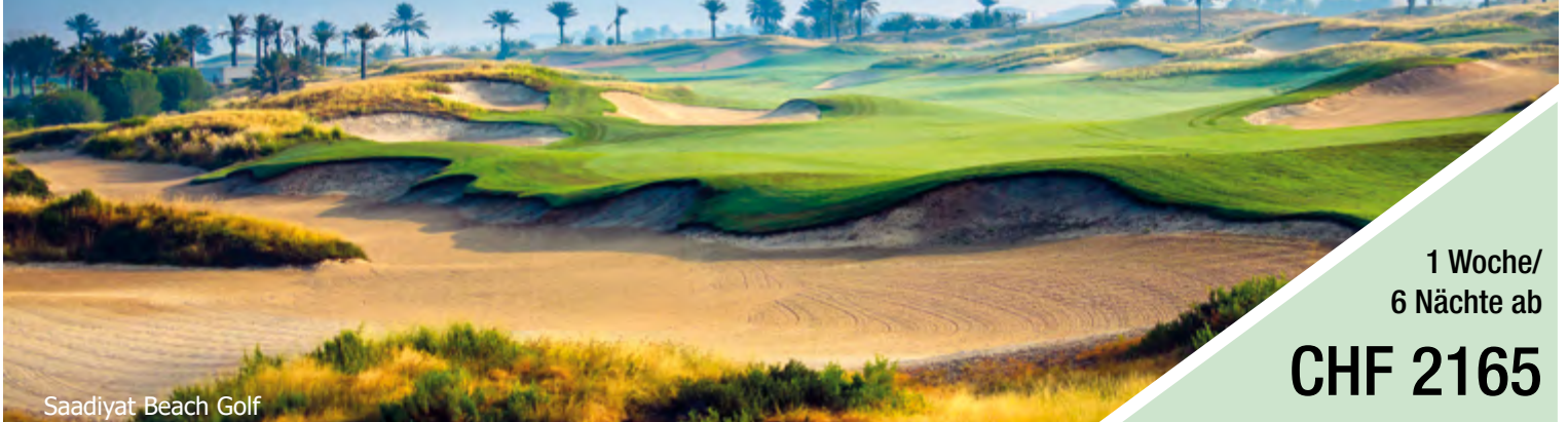
Saadiyat Beach Golf