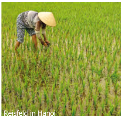
Reisfeld in Hanoi