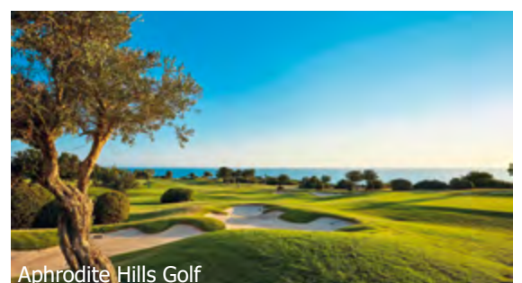
Aphrodite Hills Golf

SPECIAL unlimitiert Golf auf dem Aphrodite Hills vom 01.12.19–31.01.20 und 50% auf die Halbpension