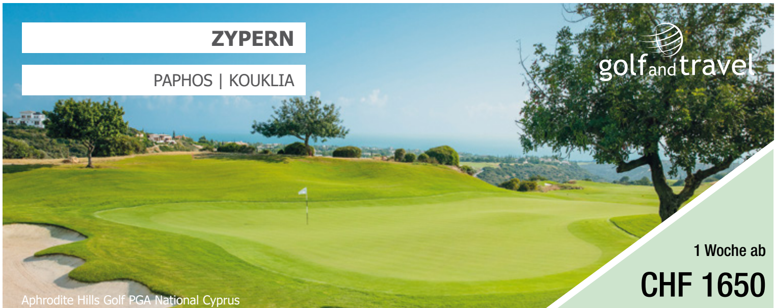
Aphrodite Hills Golf PGA National Cyprus