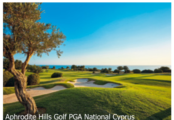
Aphrodite Hills Golf PGA National Cyprus

WICHTIG: Limitierte Anzahl Flugplätze zu oben stehenden Konditionen. Ist die berechnete Buchungsklasse nicht mehr verfügbar, behalten wir uns vor, den Flugzuschlag aufzurechnen. Früh buchen lohnt sich! d_2tb300