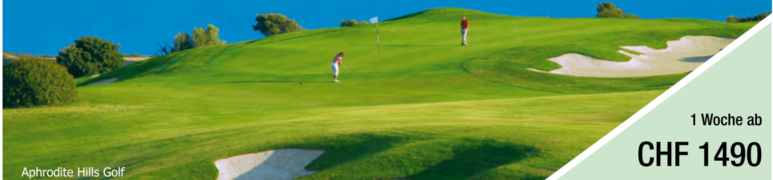
Aphrodite Hills Golf