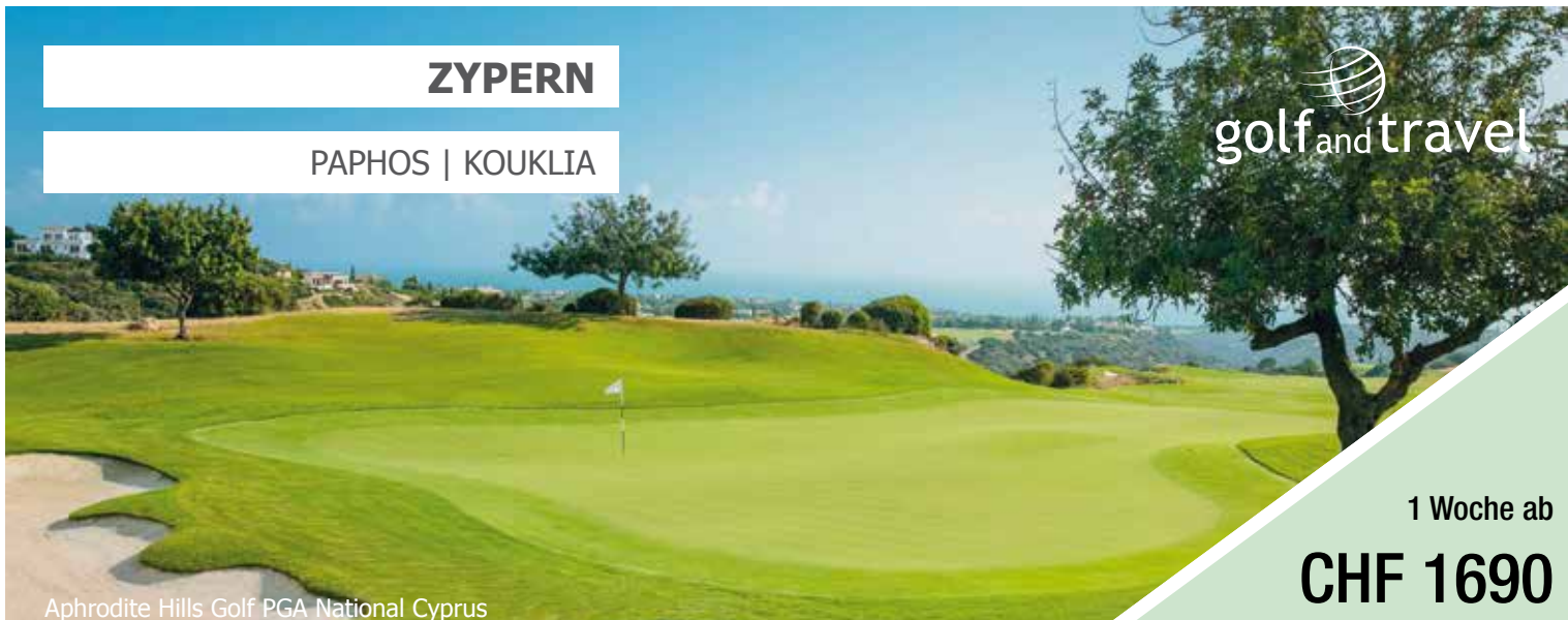
Aphrodite Hills Golf PGA National Cyprus