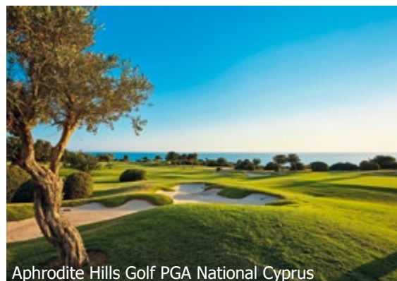
Aphrodite Hills Golf PGA National Cyprus

WICHTIG: Limitierte Anzahl Flugplätze zu oben stehenden Konditionen. Ist die berechnete Buchungsklasse nicht mehr verfügbar, behalten wir uns vor, den Flugzuschlag aufzurechnen. Früh buchen lohnt sich! d_0tb300