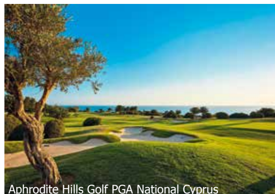
Aphrodite Hills Golf PGA National Cyprus

WICHTIG: Limitierte Anzahl Flugplätze zu oben stehenden Konditionen. Ist die berechnete Buchungsklasse nicht mehr verfügbar, behalten wir uns vor, den Flugzuschlag aufzurechnen. Früh buchen lohnt sich! tb400/275