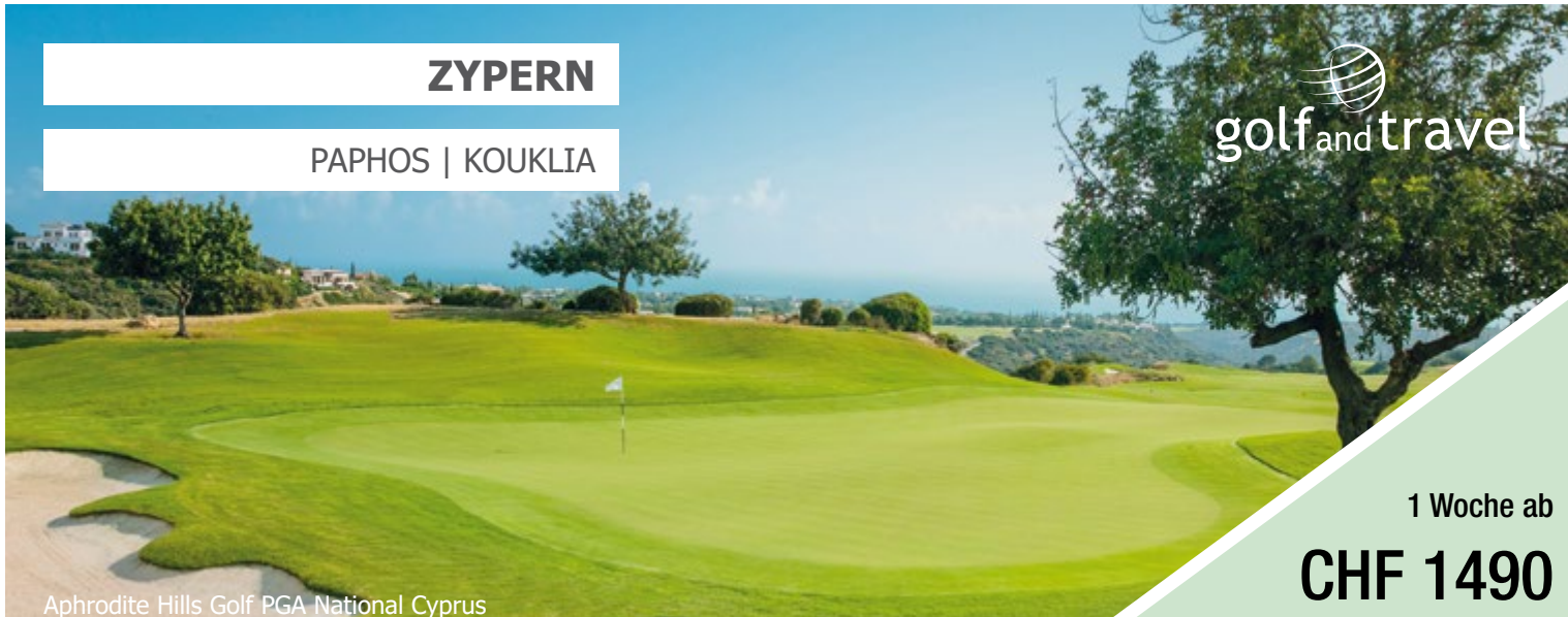
Aphrodite Hills Golf PGA National Cyprus