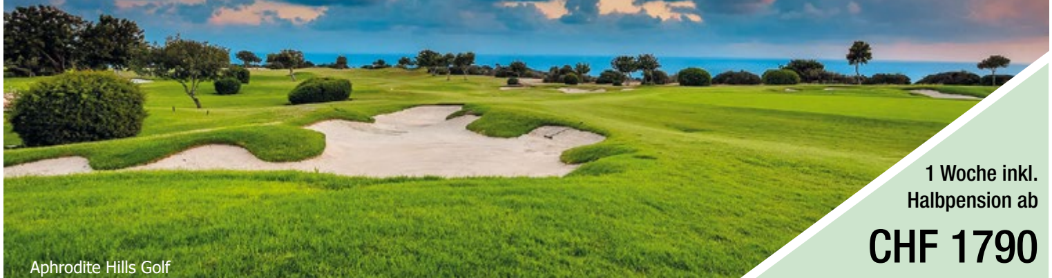
Aphrodite Hills Golf