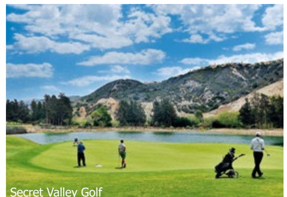
Secret Valley Golf

WICHTIG: Limitierte Anzahl Flugplätze zu oben stehenden Konditionen. Ist die berechnete Buchungsklasse nicht mehr verfügbar, behalten wir uns vor, den Flugzuschlag aufzurechnen. Früh buchen lohnt sich! d_0tb300