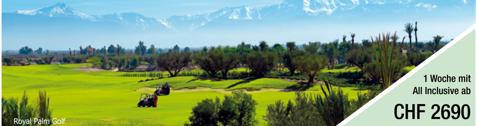
Royal Palm Golf

mit SWISS PGA PRO 14. NOV – 21. NOV 2020