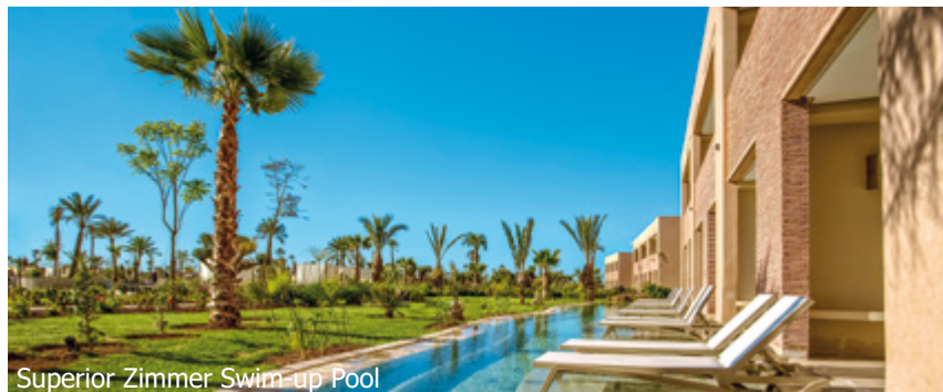
Superior Zimmer Swim up Pool

Geplante Begleitung Pro Jill Kinloch (Änderungen vorbehalten!)