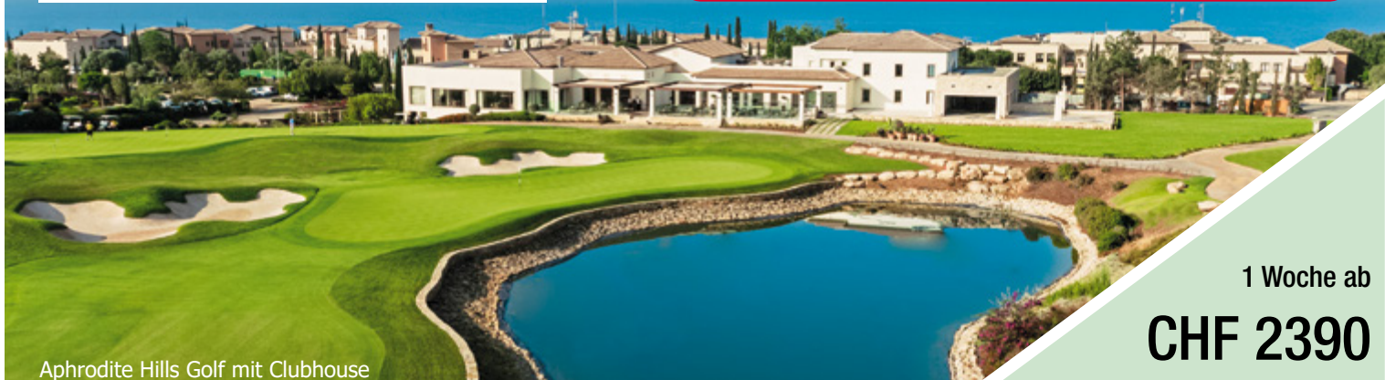
Aphrodite Hills Golf mit Clubhouse