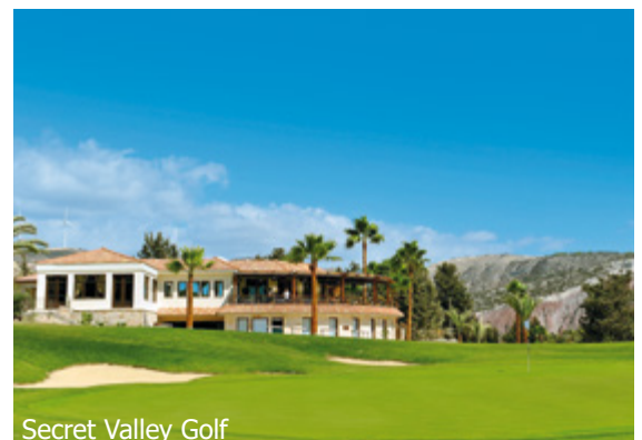
Secret Valley Golf