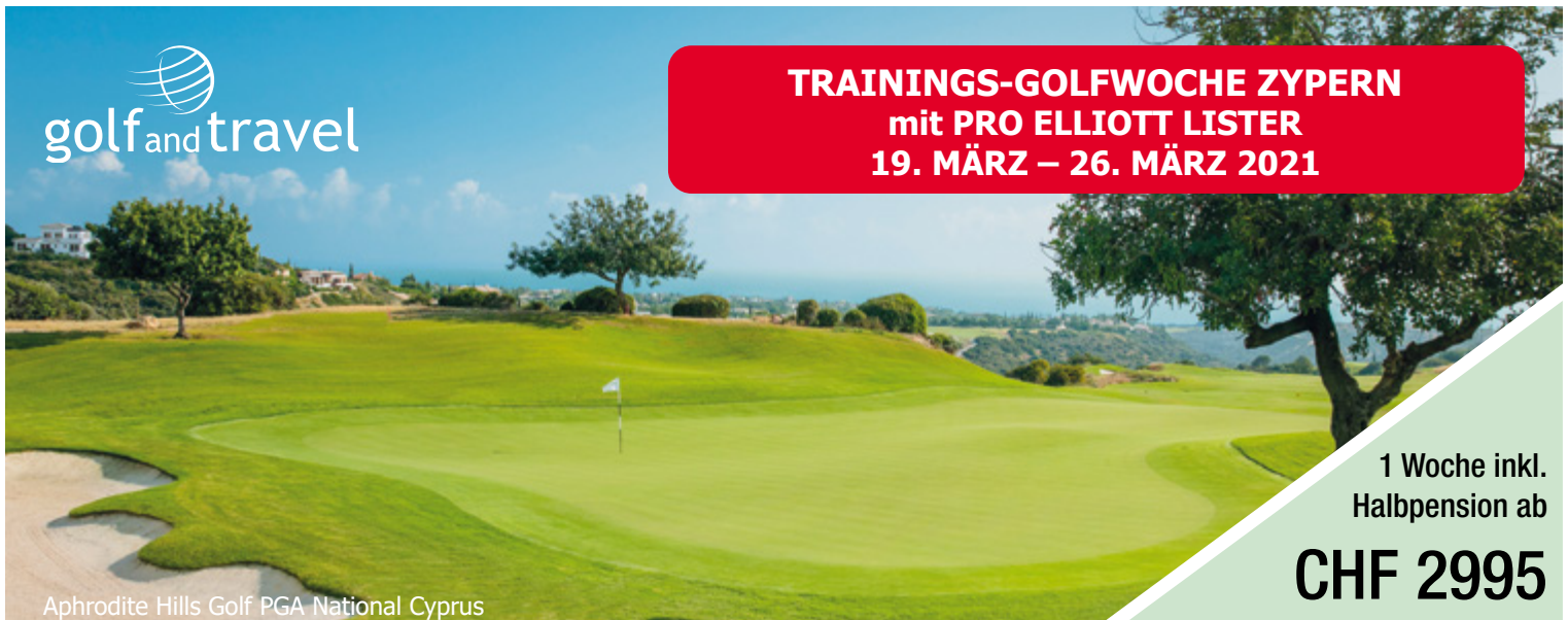
Aphrodite Hills Golf PGA National Cyprus