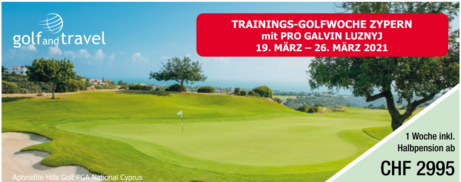
Aphrodite Hills Golf PGA National Cyprus