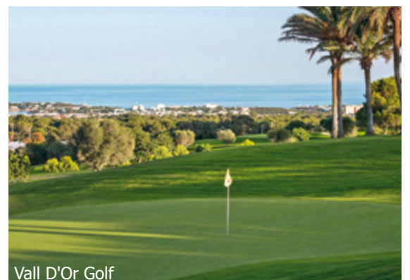
Vall D'Or Golf