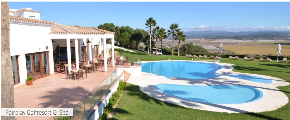
Fairplay Golfresort & Spa

Das Fairplay Golf Resort liegt in der Provinz Cádiz, die historischen Städte Jerez de la Frontera und Cádiz sind beide etwa 45 Autominuten entfernt. Dieses im typisch andalusischen Stil gebaute Hotel wurde kürzlich renoviert. Die Zimmer und Suiten verfügen über einen Flachbildfernseher, kostenloses WiFi und eine Minibar. Die meisten bieten einen Blick auf den Golfplatz, den Innenhof oder die Landschaft. Den Gästen des Fairplay steht ein Gourmet-Restaurant zur Verfügung, das internationale und lokale Küche serviert. Ausserdem gibt es ein Buffetrestaurant, eine Brasserie am Pool und ein Club House Restaurant mit Aussenbereich und Blick auf den Golfplatz. Ein luxuriöser Spa- und Wellnesscenter mit stehen den Gästen zur Verfügung. Ausserdem kann das Fitnessstudio kostenlos genutzt werden.