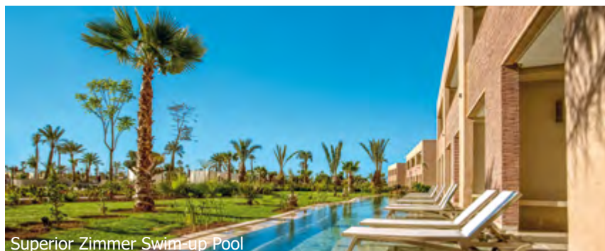
Superior Zimmer Swim up Pool