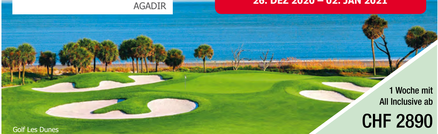
Golf Les Dunes

NEUJAHRS-GOLFWOCHEN 26. DEZ 2020 – 02. JAN 2021