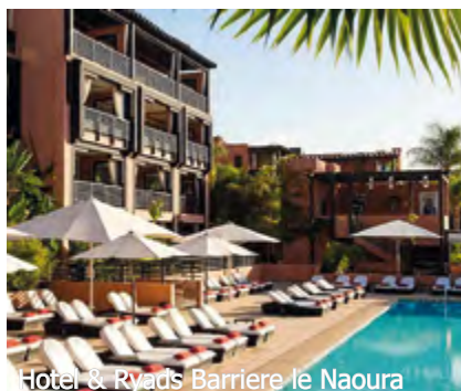
Hotel & Ryads Barriere le Naoura