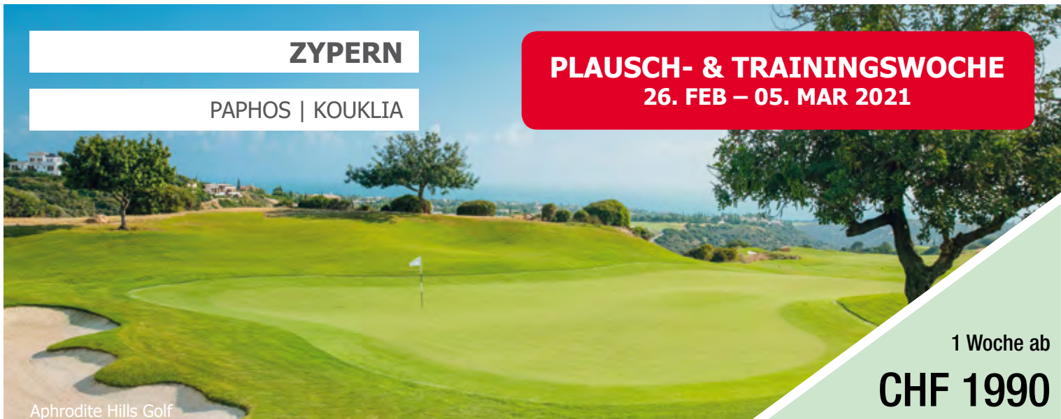
Aphrodite Hills Golf

PLAUSCH- & TRAININGSWOCHE 26. FEB – 05. MAR 2021