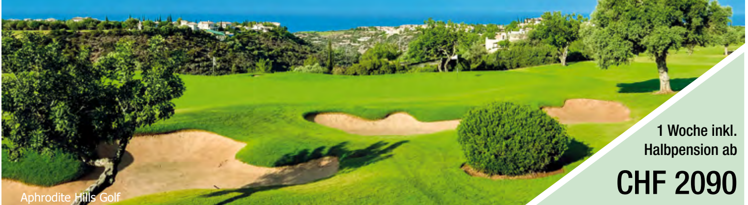
Aphrodite Hills Golf