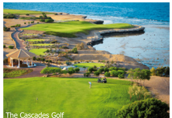
The Cascades Golf

WICHTIG: Limitierte Anzahl Flugplätze zu oben stehenden Konditionen. Ist die berechnete Buchungsklasse nicht mehr verfügbar, behalten wir uns vor, den Flugzuschlag aufzurechnen. Früh buchen lohnt sich! 0tb550